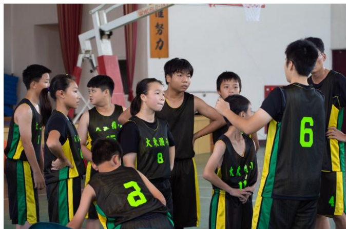
師生帶學生打比賽